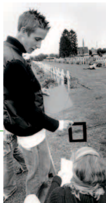
Dans le cimetière de Cerny