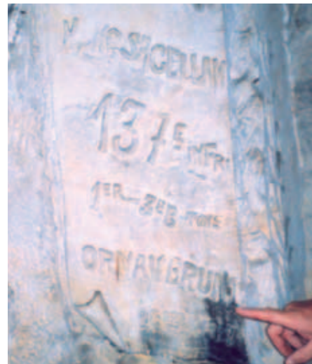
Inscription en latin dans la carrière de Rouge-Maison à Vailly rappelant que les 1 er et 3 e bataillons du 137 e RI « ont orné cette chapelle ».

Qu'y a-t-il de commun entre le fort de Condé, le cimetière allemand de Veslud, le site de l'ancien village de Craonne et la chapelle de la carrière de Rouge