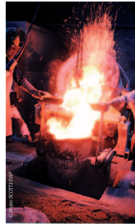
Fonte d'un des éléments de l'œuvre de Haïm Kern « Ils n'ont pas choisi leur sépulture » à la Fonderie de la Plaine à Saint-Denis (Seine-Saint-Denis), 29 - 30 septembre 1998.

Faute de toute signalisation, il arrive que des visiteurs demandent à voir le « Monument Jospin » ou même le « Monument des Fusillés ». C'est dire si la confusion existe dans les esprits depuis la polémique née du discours prononcé à la mairie de Craonne le 5 novembre 1998, le jour même de l'inauguration de la sculpture de Haïm Kern, au-dessus du parking du plateau de Californie. Une confusion qui explique peut-être – mais qui n'excuse pas ! – le vandalisme qui, à deux reprises, en mai 1999 et dernièrement dans la nuit du 22 au 23 avril, s'est attaqué au monument de bronze, à ces visages de bronze pris dans les mailles de l'Histoire et qui, comme l'explique l'artiste, « reviennent vers nous, de la terre vers la lumière ».