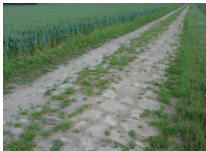
Dans la montée vers La Bove, des pavés d'avant le « Chemin des Dames ».

pensions et de rentes. Ainsi, les 502 400 livres de l'achat de la Bove viennent en