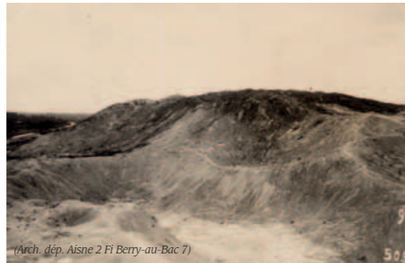
Classée en 1937, la cote 108 à Berry-au-Bac témoigne de l'âpreté de la guerre des mines. Située sur des propriétés privées, elle demeure inaccessible au public.

« Considérant que le Vieux Craonne à Craonne (Aisne) comprenant l'ancien village détruit en 1917, son cimetière et le plateau de Californie, présente, au point de vue de l'histoire et de l'art, un intérêt public en raison de sa valeur de village-martyr emblématique des violents combats engagés en 1917 pour la conquête du Chemin des Dames, et des mutineries qu'y provoqua le désespoir des soldats dont se fit l'écho l'émouvante chanson de Craonne... ».