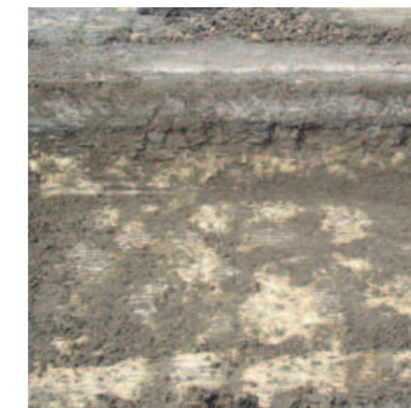
Au cours de travaux de voirie en mai 2006, la réapparition du « hérisson » de la route du 18 e siècle sous la chaussée moderne.

Mais on peut comprendre que dans la mémoire collective locale, cette route inhabituelle sur un itinéraire très secondaire et les corvées qu'elle a nécessitées ont marqué durablement les esprits. On parlera longtemps de la « route des Dames »... Et la guerre de 14-18 viendra lui apporter une autre notoriété.