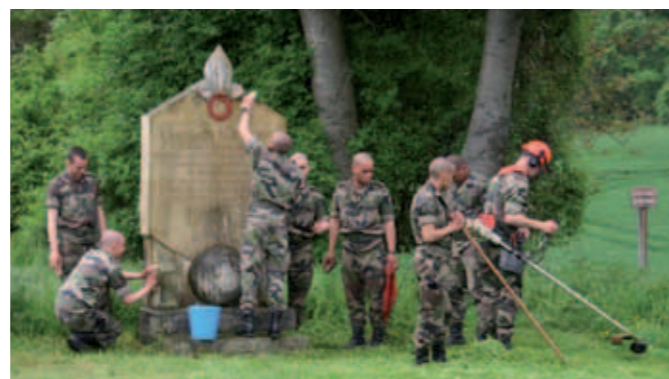
Les jeunes du 1 er RAMA en action sur le monument de la Légion étrangère à Aizy-Jouy.

Initié en 2004, le partenariat entre l'Office National des Anciens Combattants et le 1 er RAMA de Couvron pour l'entretien des monuments du Chemin des Dames se poursuit. Après les