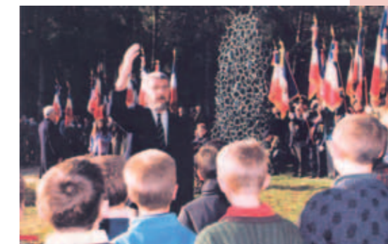
L'inauguration du 5 novembre 1998